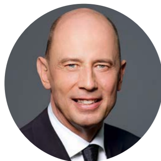
Wolfgang Tiefensee Thüringer Minister für Wirtschaft, Wissenschaft und Digitale Gesellschaft